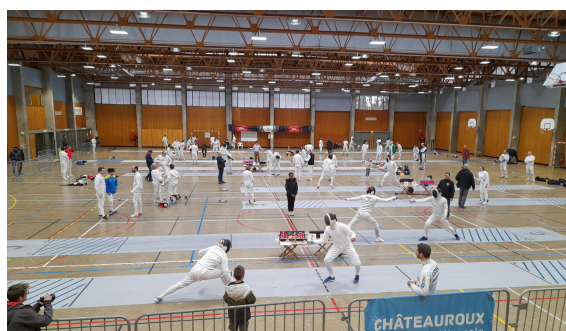
(c) Cercle de l'épée de Châteauroux